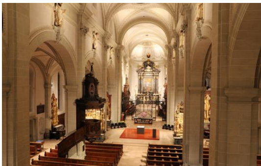
Impression der neu beleuchteten Kirche