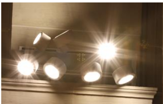
LED im Einsatz