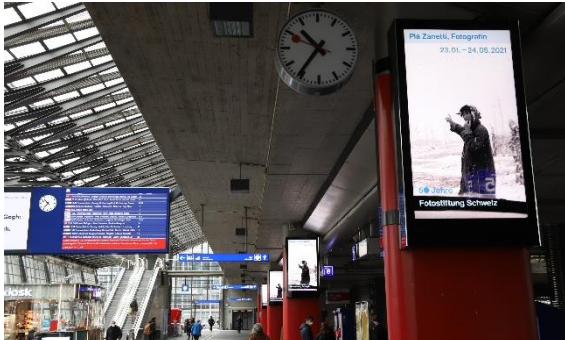
ePanels Bahnhof Luzern EG